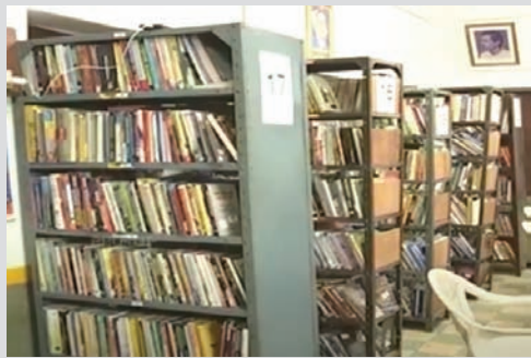
నుంచి గ్రంథాలయాలకు రావాల్సిన బకాయిలు కోట్లకు చేరుకుంటున్నా అటు ఆయా సంస్థల వారు కానీ, ప్రభుత్వం కానీ పట్టించుకోకపోవడంతో గ్రంథాలయాల స్థితి రాసరాసు మరింత దీనంగా.. దయనీయంగా మారుతోంది.

• బకాయిలు కోట్లకు చేరుతున్నా..పట్టించుకోని అధికారులు