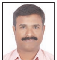
తుమ్మల బాల గంగాధర్ తిలక్